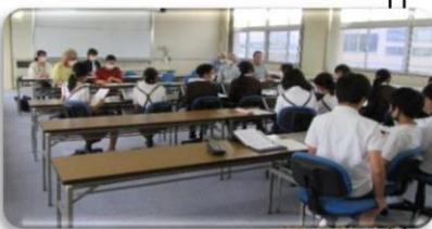
小学校で協議体を行っています。